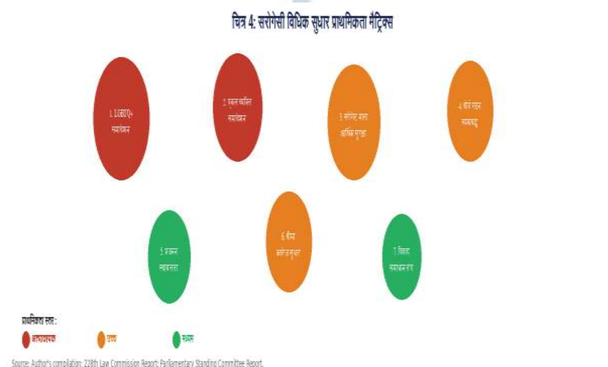
चित्र 4: सरोगेसी विधिक सुधार प्राथमिकता मैट्रिक्स

सरोगेसी विनियमन अंततः इस प्रश्न का उत्तर है कि भारतीय राज्य प्रजनन अधिकारों, महिला श्रम गरिमा, और परिवार की बहुलतावादी अवधारणा को किस सीमा तक मान्यता देता है। 56