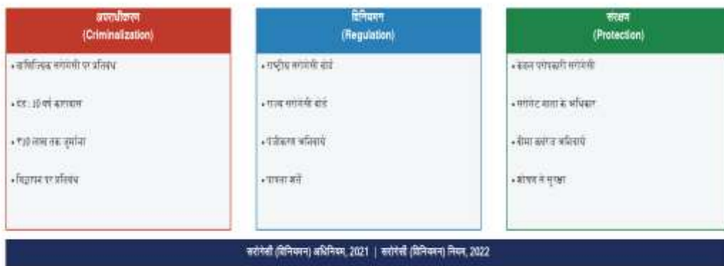
चित्र 1: सरोगेसी (विनियमन) अधिनियम, 2021 — संरचनात्मक ढाँचा